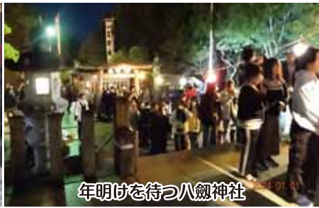
年明けを待つ八劔神社