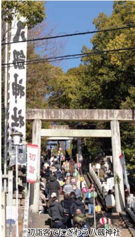
初詣客でにぎわう八劔神社

学区全体が団結し、地域の発展と住民の安全を守るために頑張りましょう。みんなの力を結集し協力して共に乗り越える喜びや成果を共有しながら、新たな一年となることを楽しみにしています。どうぞよろしくお願致します。