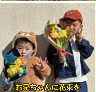
お兄ちゃんに花束を