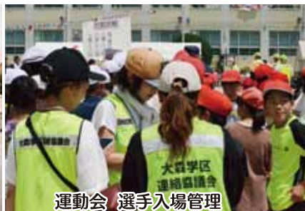
運動会 選手入場管理

多くの人が集まるイベントの運営は簡単ではないが、レクリエーション委員たちは笑顔と面倒見の良さで行事を盛り上げる。自分たちの時間を人々の笑顔のために捧げる、そんな献身的な努力を惜しまないレクリエーション推進委員の面々にカンパリー!!