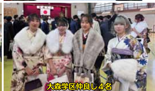
大森学区仲良し4名