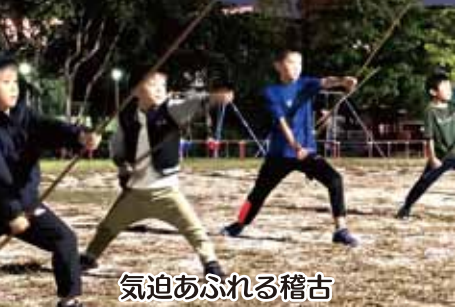
気迫あふれる稽古

子どもたちがたくさん参加してくれるようになり、その中から将来の師匠が生まれることを期待したい。