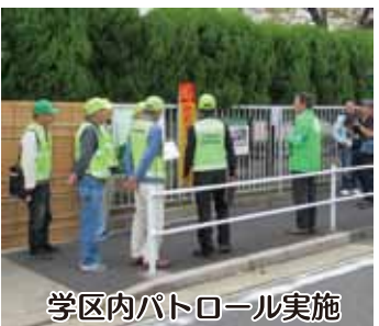
学区内パトロール実施

大森学区自治会では12月1日の午後7時から8時まで「年末特別警戒」の防犯パトロールを実施した。年末になると各種犯罪や交通事故が増加する傾向にあることを踏まえ、大森学区自治会が守山警察署と合