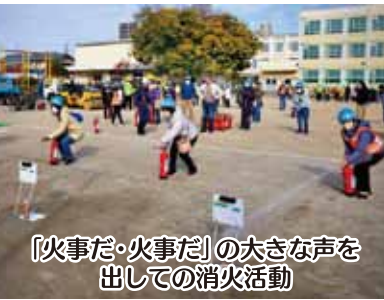
「火事だ・火事だ」の大きな声を出しての消火活動

員の指導により、水消火器を使った消火体験、倒壊した家屋からの人命救助訓練を行った。協力事業所である(有)椎名建設によるシヨベルカーなどの重機展示もあった。再び体育館内に全員が戻り、消防署からの講評を聞き、訓練は終わった。今回の各町内会からの参加者は143名であったが、訓練により身につけた実践的なスキルや知識を実際の災害時に活かせるように普段から意識しておきたいものである。