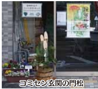
コミセン玄関の門松