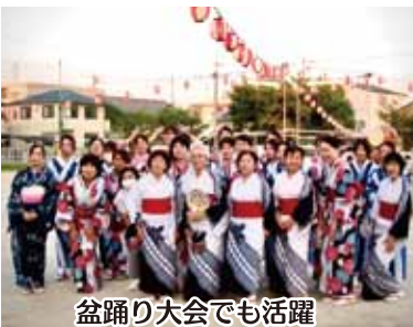
盆踊り大会でも活躍