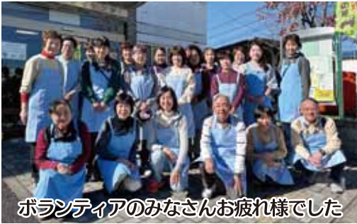
ボランティアのみなさんお疲れ様でした

役員が配達をスタートした。心を込めて準備された。届けられた弁当は、ちょうど昼食時に合わせて希望者宅に届いた。誠に心温まる活動である。