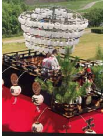
巻藁に提灯をつけた山車

子状の輪掛を取付け、その上に楯棒が地面と平行に取り付けられるようになっています。