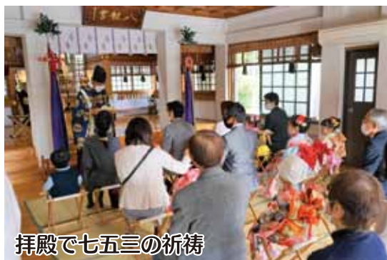
拜殿で七五三の祈禱

秋晴れの11月7日(土)と8日(日)の両日、八劍神社で七五三詣が行われた。コロナ禍にもかかわらず昨年とほぼ同数の41組の方々が参拝に訪れ、着物姿に紅をさした女の子や袴姿も凛々しい男の子らが家族と一緒に参詣し、境内は久しぶりに華やかな雰囲気包まれた。拜殿は、富田宮司が生涯安寧を願う祝詞を奏上した後、家族全員で玉串奉奠を行った。慣れない手付きの玉串奉奠ではあつ