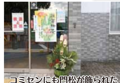
コミセンにも門松が飾られた

さて、令和3年はコロナ第3波の真ただただ中でのスタートとなった。1月7日には1都3県に緊急事態宣言が再発出され、それはすぐに愛知県にも対象が広がり、1ヶ月後には更に一ヶ月延長となった。今年もコロナと戦う年になりそうである。各自が対策を確実に実行していくことがとにかく肝要となる。