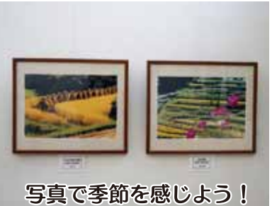
写真で季節を感じよう!

今年のコミセン祭は「3密」を避けるために中止となったが、コミセンで開設されている文化教室などの作品の展示は行われた。書道の「翠鳳社」「女性会書道クラブ」「墨美会」そして「大森写真同好会」の力作・労作が10月から12月にかけてコミセンの2階に通じる階の壁に順次展示され、コミセンを訪れた人たちの目を楽しませていた。また、青少年育成協議会のポスター展に応募してくれた小中学生の「非行・犯罪防止ポスター」も併せて掲示された。コロナ禍の世相を反映して、