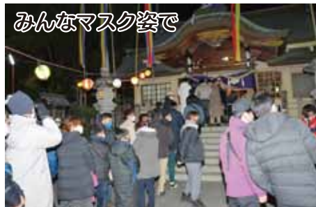
みんなマスク姿で

年末年始の大森点描 コロナ終息と平穏な日常を願う 新年へと日付が変わる時刻が近づくと、寒波到来の中、令和2年の終りを告げる除夜の鐘が法輪寺と大森寺から大森の町に響き渡り、八剣神社の石段には参拝客の長い列ができた。午前0時の越年太鼓を合図に初詣が始まり、参拝客はマスクを付け、少しでも密を避けながら新年の幸せを願った。