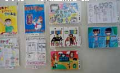
ポスターは後日掲示板へ

これらのポスターは後日、各町内にある自治会の掲示板に貼り出し、住民に生活安全を促す役割を担う一助となる。マスクや手洗いの注意喚起などコロナ感染予防に関するポスターが目立つたが、中には継続して発生している特殊詐欺を警告するポスターもあった。このポスターは後日、各町内にある自治会の掲示板に貼り出し、住民に生活安全を促す役割を担う一助となる。