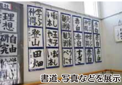
書道、写真などを展示

青色パトロール防犯活動 犯罪のない安心安全な町に地域を巡回し子供たちの安全を見守る