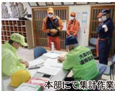
本部にて集計作業

まわってカードを確認し て町内会長に報告し、町 内会長が町内全体の状況 を取りまとめ、コミセ ンの訓練本部に連絡する 手順となっている。初め の訓練で、かつコロナ 禍の最中であり、連絡