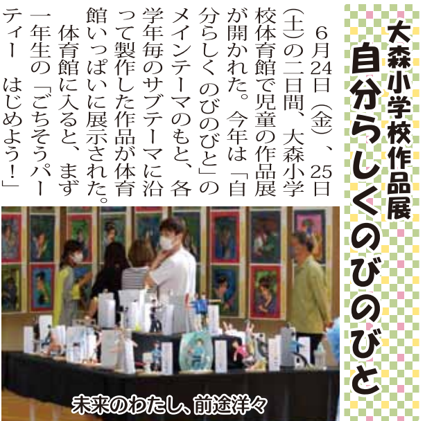
未来のわたし、前途洋々

6月24日(金)、25日(土)の二日間、大森小学校体育館で児童の作品展が開かれた。今年「自分らしくのびのびと」のメインテーマのもと、各学年毎のサブテーマに沿って製作した作品が体育館いっぱい展示された。体育館に入ると、まず一年生の「ごちそうパーティー はじめよう!」が目に入る。そして中央には、森の子学級の「がぶつと開運!大森獅子」が周りを見渡すように並んでいる。奥には6年生の「未来のわたし」。スポーツ選手や歌手・美容師