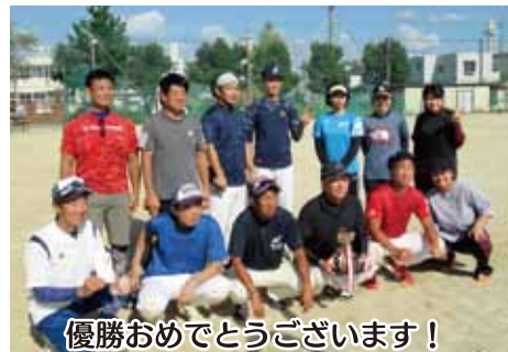
優勝おめでとうございます！

優勝決定戦は、今尻町と大森一丁目・二丁目連合の対戦となった。決勝戦にふさわしく両チーム共にエラーもなく、引きしまった好ゲームで緊張感たつぷり。勝敗は初回に1点を先制した大森一丁目・二丁目連合が、鉄壁の守備で守りきり、平成24年以來の優勝を成し遂げた。