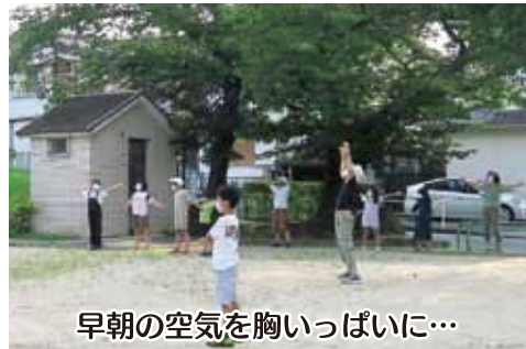
早朝の空気を胸いっぱい...

町内会主催・大森長寿会協賛のラジオ体操が西新田公園で行われた。初日はさわやかに晴れて、蝉しぐれの中、30名を超える老若男女が公園に集まった。