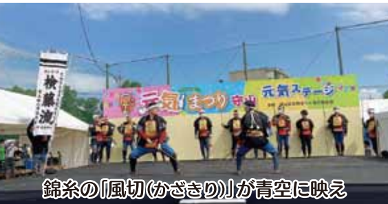
錦糸の「風切(かざきり)」が青空に映え

毎年秋に、小幡にある三菱電機守山グラウンドで守山区主催の「元気まつり守山」が開催される。令和5年2月が守山区の区制60周年に当たることもあり、今年度は区制60周年記念として9月25日(日)に、例年になく盛大に催された。