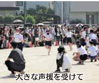
大きな声援を受けて

5月28日(土)に大森小学校の運動会が実施された。新型コロナの感染防止のため、運動会は1年生と6年生、2年生と