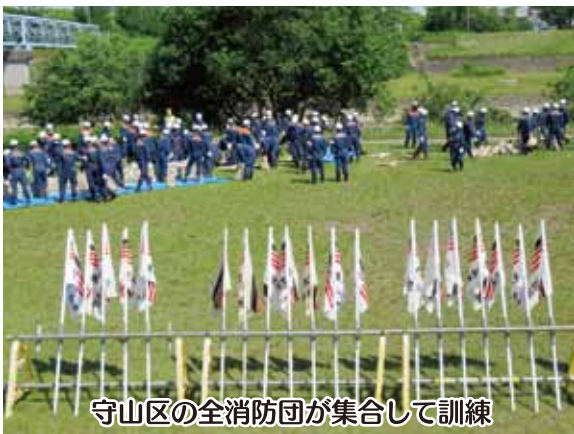
守山区の全消防団が集合して訓練

守山区内の全消防団が矢田川大森橋の下の河川敷に集合し、大規模災害により守山区内に浸水家屋が多数発生したという想定で行われた。参加した隊員は総勢160名ほどで、3中隊に分れての訓練である。