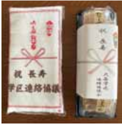
登録者への記念品

9月19日(月)の「敬老の日」に予定していた大森学区の敬老会式典は、今年も新型コロナウイルス感染拡大の第7波のため中止となり、楽しみにされていた皆様には残念な結果となっていました。昨年と同様に敬老会登録者には記念品として長寿タオル