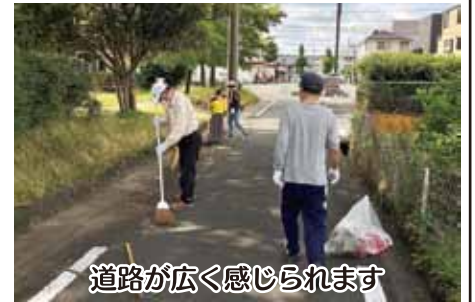
道路が広く感じられます

地域をきれいにするという共通の目的を持って清掃活動を行う中で、世間話や近況報告などの情報交換を行い、町内も衛生的できれいな状態に保たれる。そして、地域のつながりも強化され、地域に一体感も生まれる。この一体感防災や防犯においても効果をあげることに、まさに一石二鳥である。清掃活動に参加いただいた皆様、本当にありがとうございました。