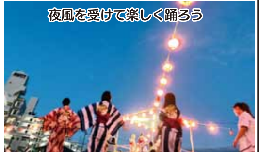
夜風を受けて楽しく踊ろう

話された。会場には浴衣姿の子供さんや若者の姿も多く見受けられ、盛り上げに一役買っていた。踊りの最後は恒例の炭坑節である。連絡協議会のメンバーが檜に登って楽しく踊った。まさに学区が一体