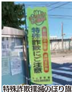
特殊詐欺撲滅のぼり旗

退グッズ「詐欺バスター」を配布、③特殊詐欺警戒の「のぼり旗」を町内会長宅やコンビニ・銀行などに掲げる、④被害防止を呼びかけるポケットティッシュを各所で配布するなどの活動を行っている。詐欺被害は誰でもある可能性があるため、今一度警戒心を高めていただきたい。