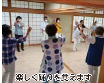
楽しく踊りを覚えます