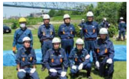
活躍した大森消防団