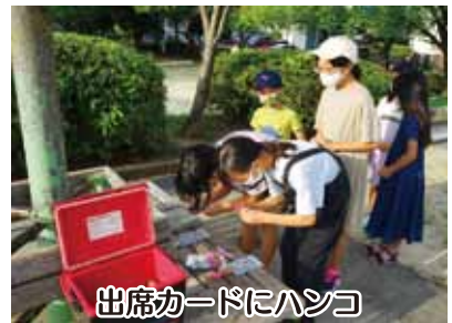
出席カードにハンコ

6時半に「おはようございます」とのリーダーの挨拶の後、参加者たちは、NHKラジオに合わせてラジオ体操第一と第二で体を動かした。普段は体操をすることがない年配者も、曲