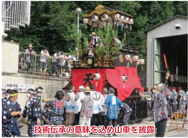
技術伝承の意味を込め山車を披露