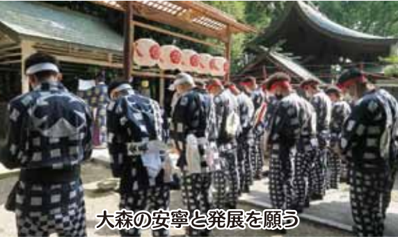
大森の安寧と発展を願う