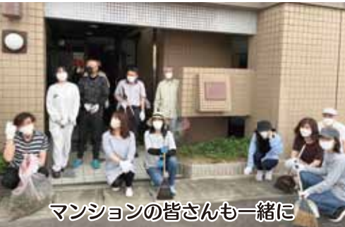
マンションの皆さんも一緒に

なお、一斉清掃に先立ち、今尻町が、脇田町の境界を流れる天神川の除草を尾張建設事務所に依頼したところ、5月31日から土手の除草作業が行われ、雑草だけでなく、川が見違えるようきれいになった。行政の対応にも感謝である。