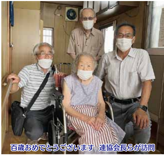
百歳おめでとうございます 連協会長らが訪問

9月19日(月)の「敬老の日」に予定していた大森学区の敬老会式典は、今年も新型コロナウイルス感染拡大の第7波のため中止となり、楽しみにされていた皆様には残念な結果となっていました。昨年と同様に敬老会登録者には記念品として長寿タオル