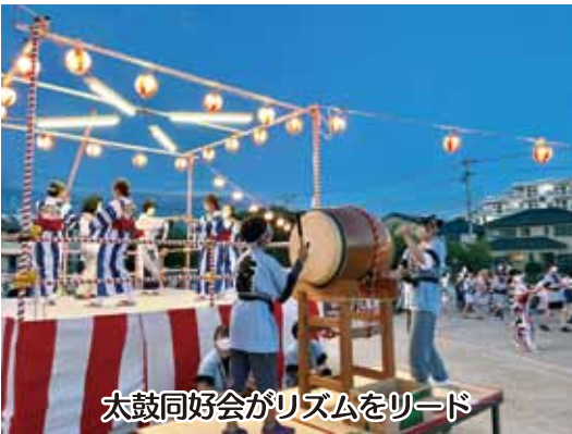
太鼓同好会がリズムをリード

グラウンドの中央には檜(やぐら)が建てられ、その上には四方に紅白の祭り提灯が吊されている。また檜脇には台の上に大太鼓が据えられて盆踊りの雰囲気溢れんばかりである。