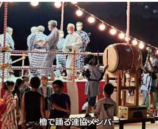
檜で踊る連協メンバー

の交流が深まり、大森学区がますます発展することを願います。また猛暑の中で準備に奔走して下さった自治会、消防団、旧女性会や大森太鼓打ちの会のメンバーなど、関係者の皆様に感謝申し上げます」と