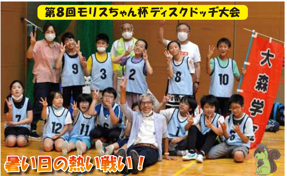
暑い日の熱い戦い!

7月2日(土)第8回モリスちゃん杯学区対抗ディスクドッチ大会が守山区スポーツセンターで開催された。コロナ禍のために三年ぶりの開催となったが、コロナ感染防止の観点から無観客とし、午前と午後の2部制で行われた。選手はすべて小学生で、大森学区は午前