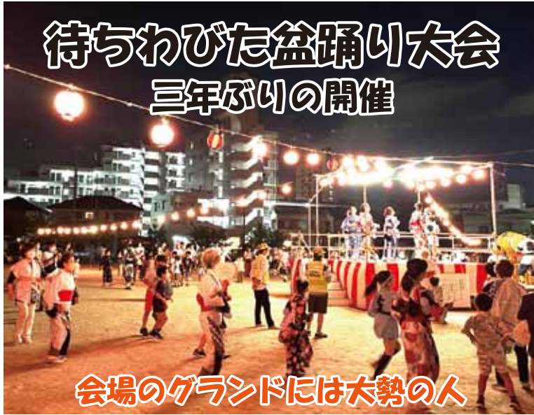
会場のグラウンドには大勢の人

7月23日(土)大森小学校グラウンドで大森学区連絡協議会主催の盆踊り大会が三年ぶりに開かれ、待ちわびた多くの人が参加した。