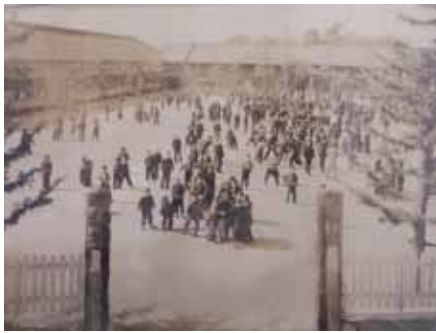
昔の大森小学校(たぶん昭和30年頃)

■ 昭和29年(1954) 守山町が守山市になったのに伴い「守山市立大森小学校」と改称。