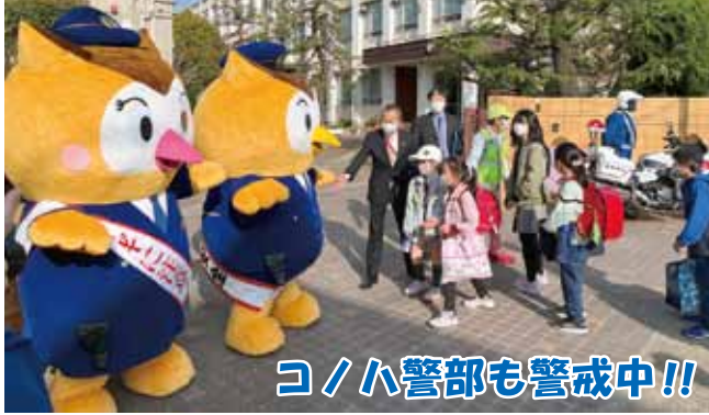
コノハ警部も警戒中!!

「コノハけいぶママ」が待ち受けて、登校して来る児童たちを迎えた。児童たちはちよつと驚きながらも笑顔で挨拶して校内に入って行った。