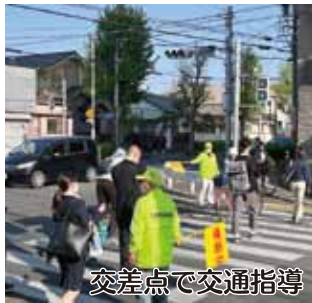
交差点で交通指導

と中町田交差点とに分かれて交通指導を行った。途中、守山警察署のパトカーによる巡視もあった。 今年の愛知県の交通事故死者数は4月末時点で昨年同時期より14人増え43人となり、不名誉な全国ワーストの状況である。大森学区は幸いにも死亡事故は無いものの人身事