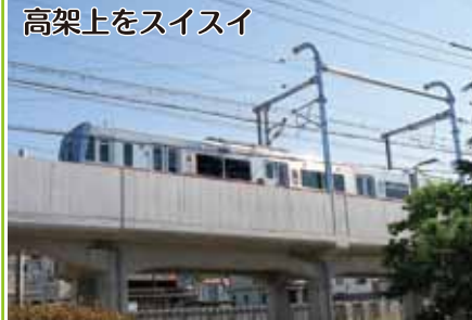
高架上をスィスイ

平成26年に始まった名鉄瀬戸線高架工事(大森・金城学院前園駅と小幡駅間)は、約8年を経て令和4年3月19日に上り線(栄町方面)が開通した。高架工事の大きな狙いは、交通量の多い国道302号線の踏切と瀬戸街道の踏切をなくし、渋滞を解消することである。