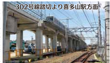
302号線踏切より喜多山駅方面 高架と下の線路の間に下り線の高架が立ち上る

した。小学校の正門横には「あいさつはみんなをつなぐあいさつ」の看板が掲げられており、また「挨拶はみんなをつなぐ魔法の言葉」との格言もある。大声であいさつをする児童たちは、まさに可愛い「魔法使い」に変身である。