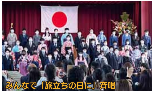
みんなで「旅立ちの日に」斉唱

栗本校長先生は式辞で「自分に自信を持つこと」「多様性を認め合うこと」が重要であり、それを身につけることで「和」の精神が培われると話された。続いて卒業生による「門出の言葉」、各自が過ごした六年間の思い出を順々に繋いで語り、先生方と家族への感謝の言葉で締めくくった。 最後に卒業生全員で「旅立ちの日に」を斉唱し、「私たちは、いま新しい未来へ旅立ちます」と力強く宣言して式は終了となった。