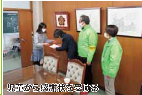
児童から感謝状を受ける

毎年年度末に、登下校時の児童を事故・事件から守る活動をする団体や個人に対し、大森小学校児童会が感謝とともにお礼をする「交通指導感謝の会」が行われる。