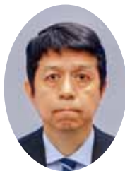
守山環境事業所長