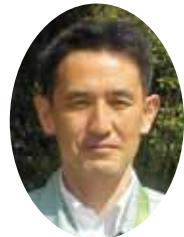
守山土木事務所長